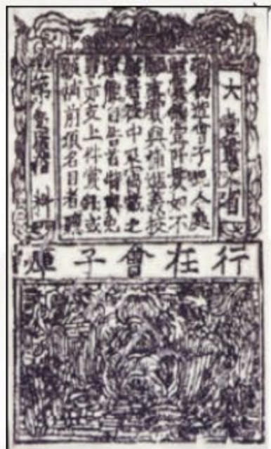
南宋“会子”铜版拓片