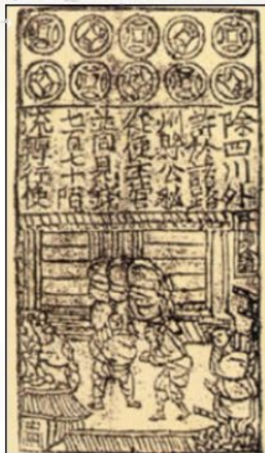
北宋“交子”铜版拓片