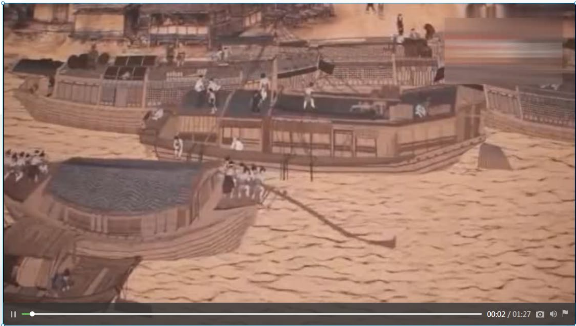
张择端 《清明上河图》 动态图