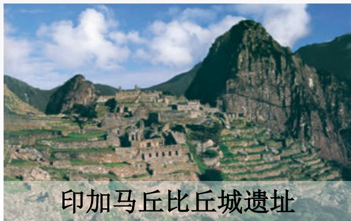
印加马丘比丘城遗址

印第安人从特斯科科湖中捞起淤泥，堆积在固定于水中的木排上，形成浮动园圃。淤泥非常肥沃，耕种者甚至每年可以从他们的田园中获得7次收成。——《中外历史纲要》（下）