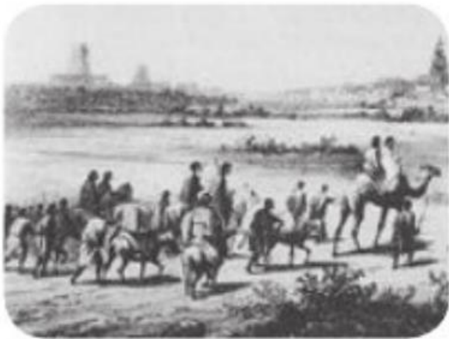
▲ 沙漠商队（绘画作品）

课前导入： 提供了19世纪中叶德国艺术家创作的一幅版画，描绘了一支沙漠商队即将到达廷巴克图的情景。