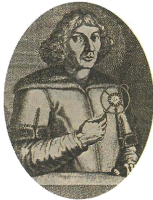
▲ 哥白尼(1473—1543) (绘画作品)