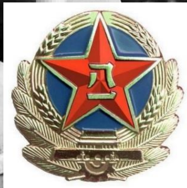
中国人民解放军军徽