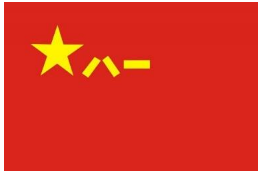
中国人民解放军军旗