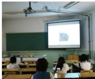
2007年的北京四中教室