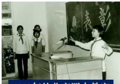
1982年的北京四中教室