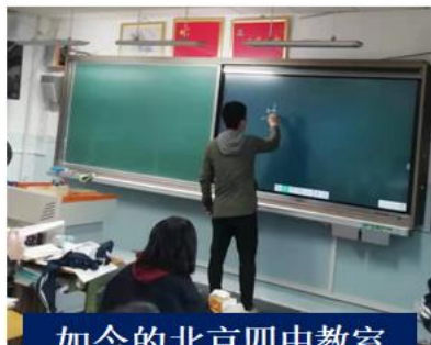
如今的北京四中教室