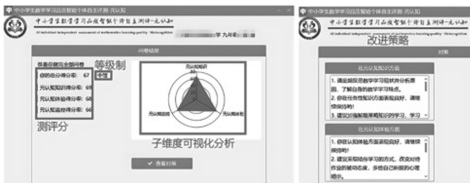
图3 数学学习品质智能个体自主测评与施策系统功能界面

在智能个体自主测评与施策系统中,学生完成测试后,可即时查看个人诊断结果与针对性改进策略。该系统界面友好、反馈直观,便于学生自主反思与精准改进。以一位九年级学生参与初中数学元认知测评为例,系统根据其作答数据,自动生成了涵盖各维度得分、等级评定及个性化改进建议的诊断报告(见图3),形成了“测评—诊断—施策”的完整闭环,充分体现了智能技术赋能数学学习品质精准提升的实践价值。